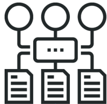
Двухэтапный конкурс в электронной форме