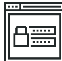
Запрос предложений электронной форме