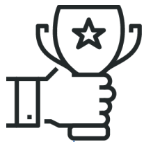
Конкурс в электронной форме