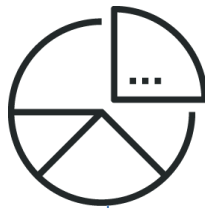
Конкурс в электронной форме с ограниченным участием