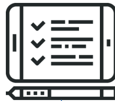
Запрос котировок в электронной форме